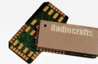
CÂBLES, USB ET MODULES